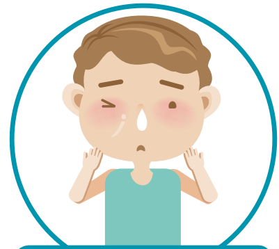
3. ریزش بینی