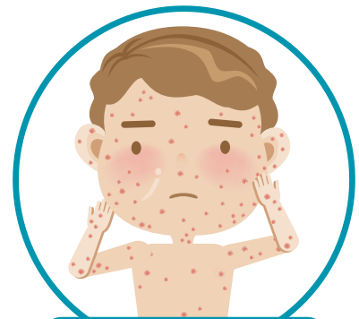
6. دانه های ریز جلدی