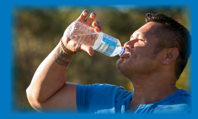
*** Toe fa'atumu fagu inu mai le paipa ma tu'u ile pusa-'aisa pe'a e mana'omia .

O vai-inu suamalie ia faaleoleo mo feiloa'iga taua ae taumafai ia lava se ipu e tasi e te inuina.